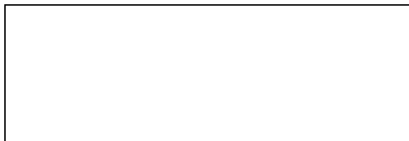
Схема границ эксплуатационной ответственности сторон

Прочие сведения по установлению границ раздела эксплуатационной ответственности сторон _____